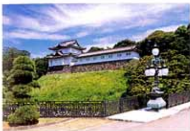
正门铁桥（二重桥）与伏见櫓 （地图9·10）

这里被通称为‘二重桥’，有着日本国民所熟知的正门铁桥和据说是在三代将军家光时期从京都·伏见城迁移过来的伏见櫓。📍 No.16, No.18